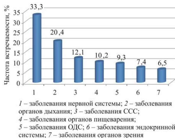
Рис. 1. Частота встречаемости различных заболеваний у работников мебельного производства

На рис. 2 представлена структура впервые выявленных заболеваний с учетом стажа работы и условий труда по нозологическим формам.